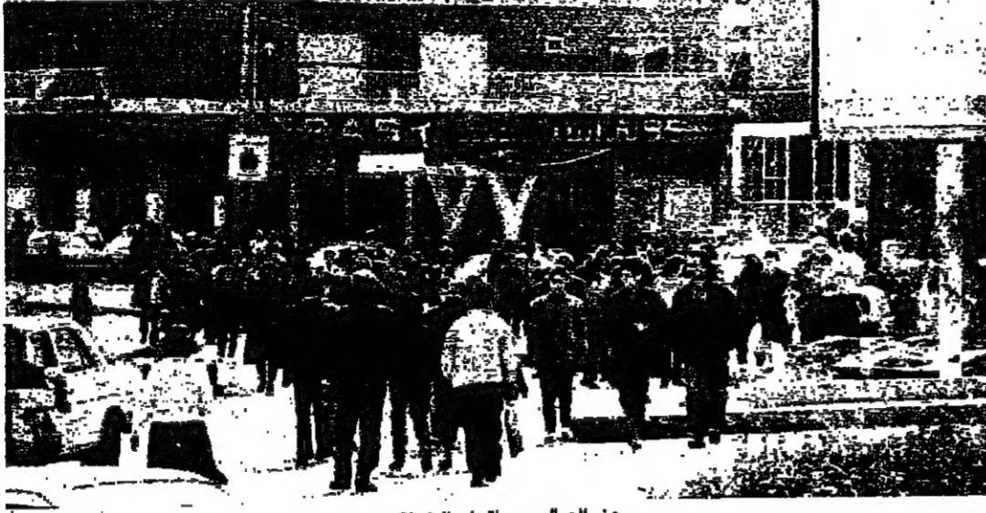
من الصالون يجتمع النكوانه